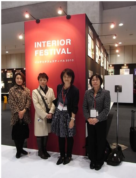
最終日の記念写真